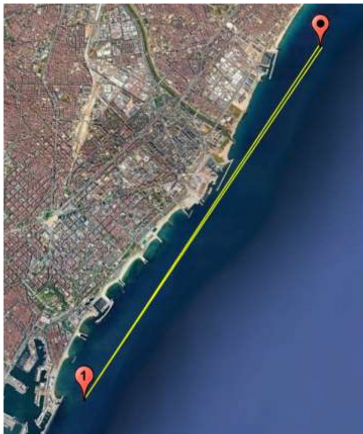
Balisa per estribor